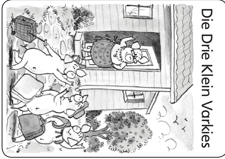
Die Drie Klein Varkies

Ons is veilig teen die groot, nare wolf.